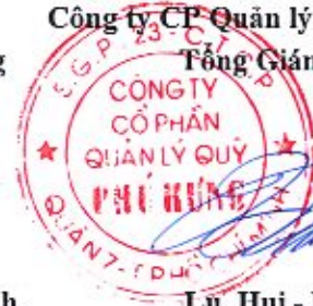
Lư, Hui - Hung